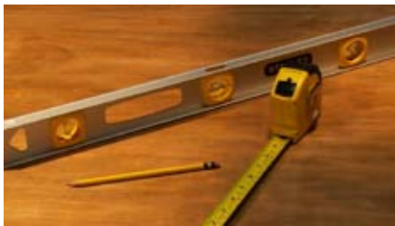
4 Cinta métrica, nivel y lápiz.