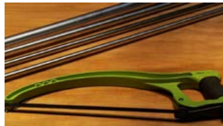
5 Segueta o sierra de manual.