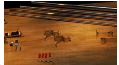
6 Soportes (frontales, laterales, de techo), barras de cortina, ramplús y tornillos adecuados.