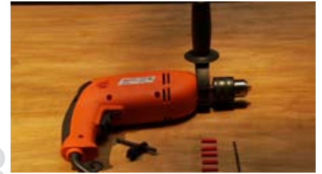
3 Taladro y mechas.