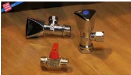
4 Llave de paso media pulgada