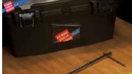
2 Llave inglesa.