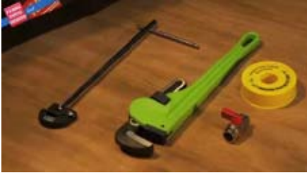
1 Llave ayudante plomero