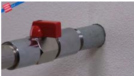
1 Cierre la llave principal de paso del agua.