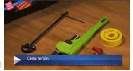
3 Cinta teflón ® (es una marca registrada de DuPont)..