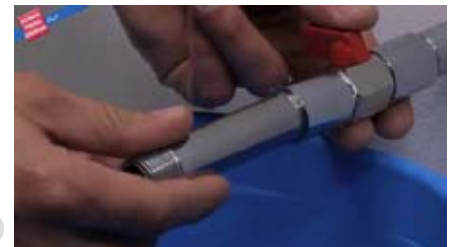
3 Desenrosque las canillas o niple que se encuentran conectadas.